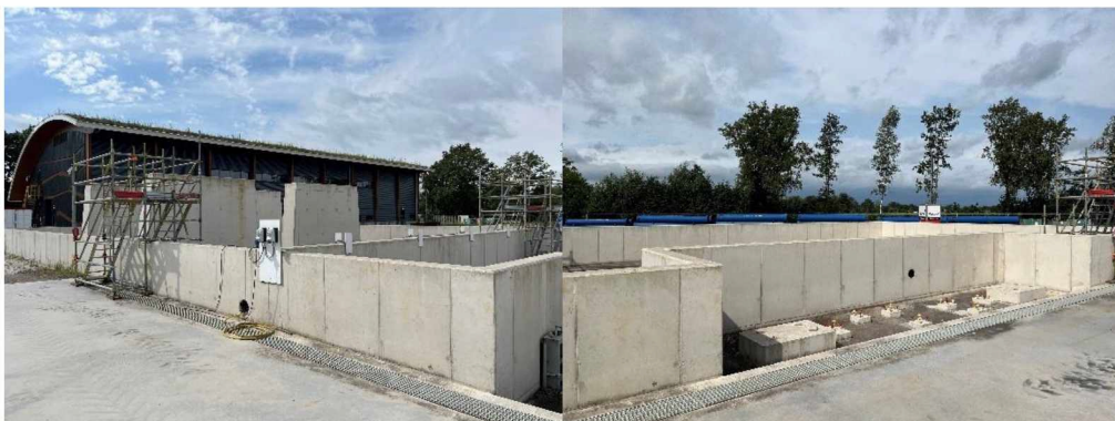
Foto 4 en 5, respectievelijk fundering ontgassers/separators en tankopslag dakolie.

Het terrein rondom het bedrijfsgebouw is met een hek afgesloten. Op dit deel van het terrein is de fundering t.b.v. de opslagtank voor dakolie en de fundering voor de 2 ontgassers/separators aangelegd. Deze fundering is onderdeel van de (gemeentelijke) bouwvergunning voor het bedrijfsgebouw, maar is feitelijk een (ook) onderdeel van het toekomstig mijnbouwwerk.