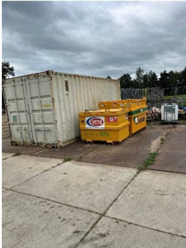
Foto 10 dieselopslag