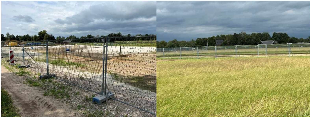
Foto 6 en 7: grondverzet voor respectievelijk zoutwinningslocatie H02 en H01

Ter plaatse van de zoutwinningslocaties H-01 en H-02 is grond afgegraven t.b.v. toekomstige aansluiting van het leidingtracé.